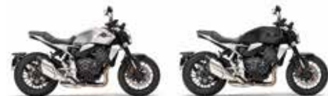
Nouveau coloris Mat Beta Silver Metallic