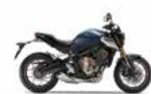
Mat Jeans Blue Metallic