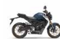
Nouveau coloris Mat Jeans Blue Metallic