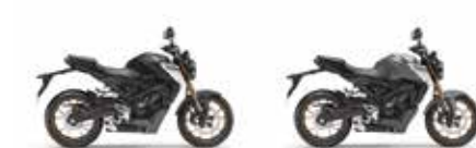
Nouveau coloris Mat Gunpowder Black Metallic