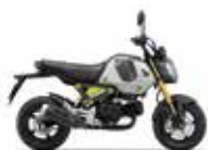
Force Silver Metallic