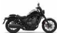
Gunmetal Black Metallic