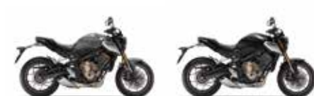
Nouveau coloris Pearl Smoky Gray